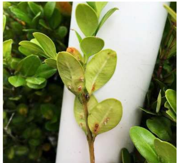
Figuras 10 y 11. Daños de un minador de hojas en un boj.