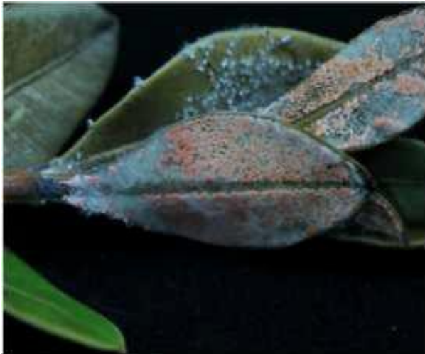
Figura 8. Fuego de Volutella en un boj.

Los chancros o manchas negras se desarrollan en los tallos verdes de las plantas infectadas con el fuego bacteriano del boj (figura 5). Este es el principal síntoma que se puede usar para diferenciar la enfermedad de otras enfermedades del boj como el fuego de Volutella (figura 8) y las manchas de hoja de Macrophoma (figura 9), las plagas de boj como el minador de hojas del boj (figuras 10 y 11) o las enfermedades abióticas del boj como las heridas invernales o las escaldaduras de sol (figura 12).