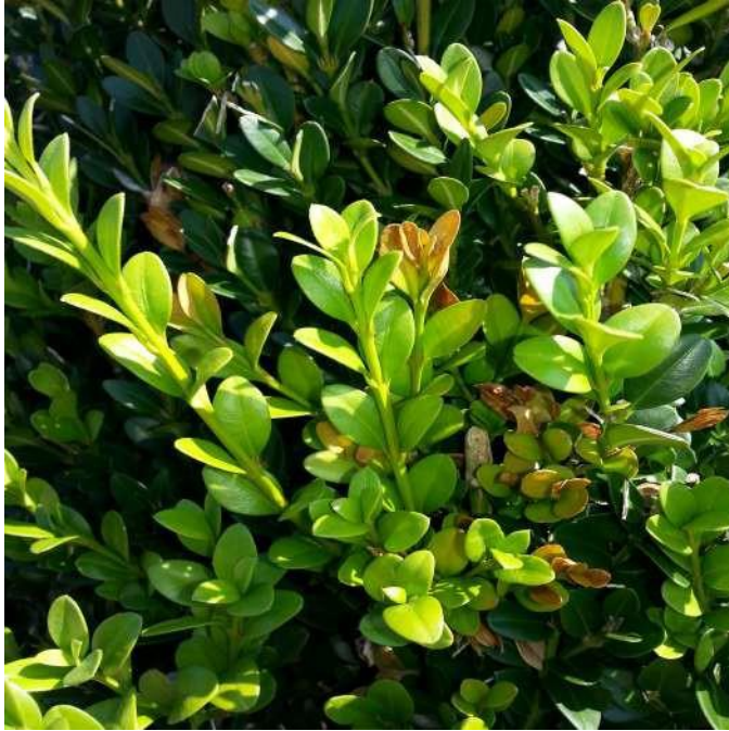
Figura 12. Enfermedad abiótica en un boj.