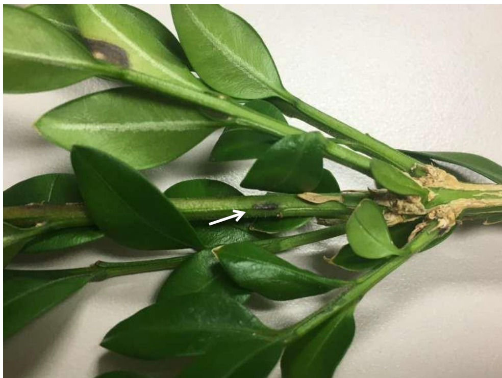
Figura 5. Chancro negro en un tallo de boj causado por Calonectria pseudonaviculata .