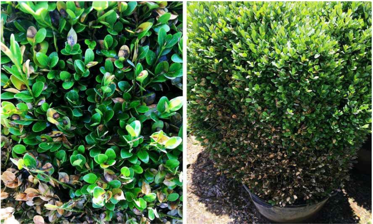
Figura 3 y 4. Manchas en las hojas y la defoliación causada por Calonectria pseudonaviculata en un boj.