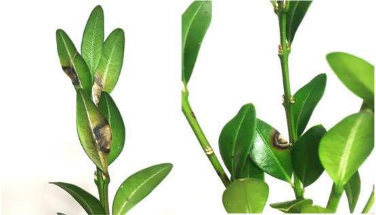
Figuras 1 y 2. Manchas del fuego bacteriano del boj en hojas.